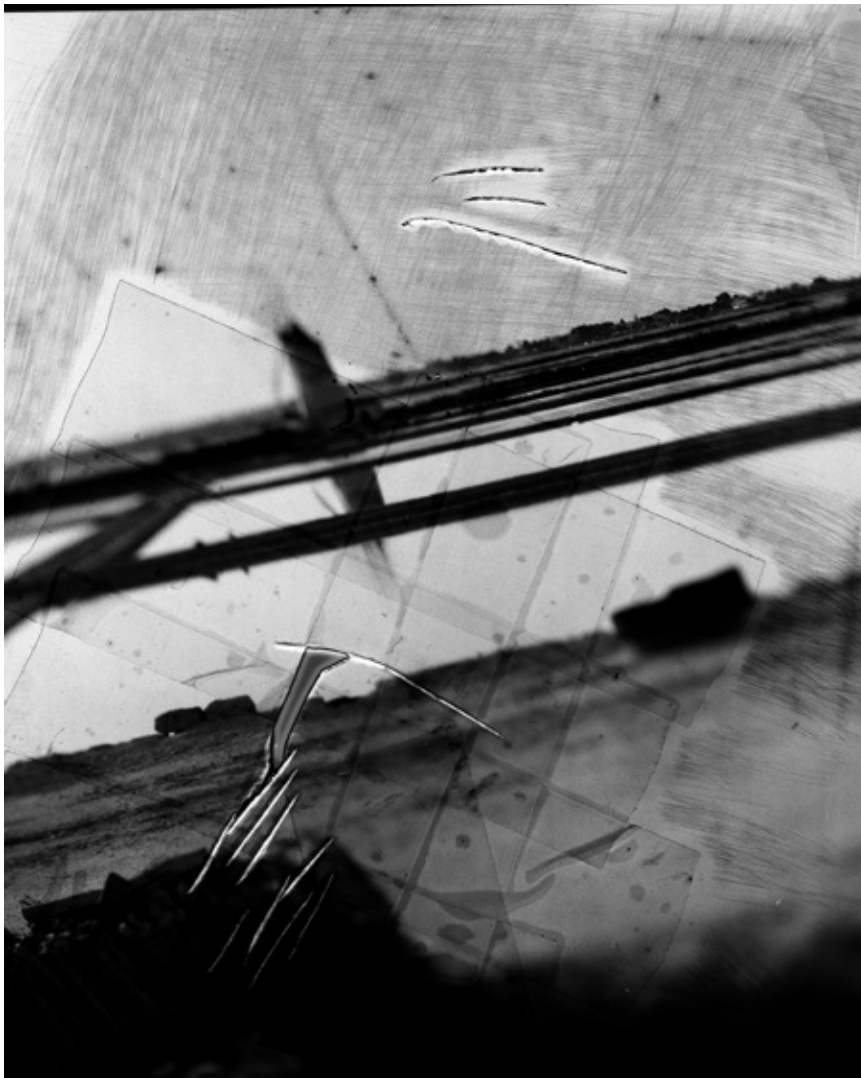
La terra metafisica #46, 2019